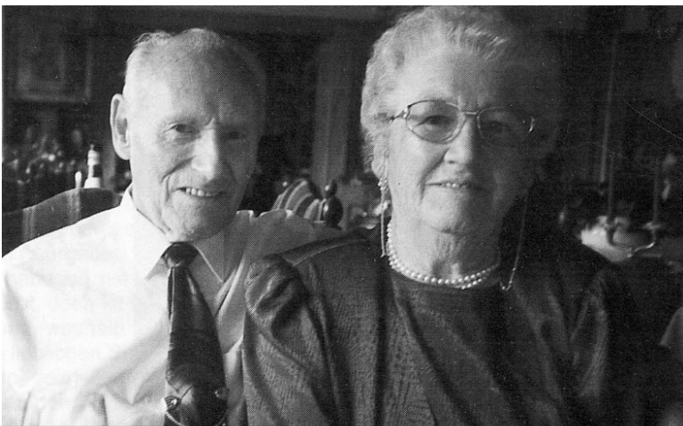
Die beiden Jubilare im August 1995

recht herzlich zu gratulieren. Wir wünschen für die Zukunft alles Gute.