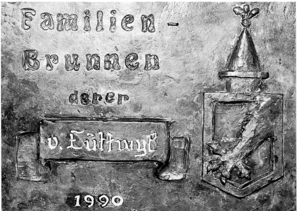
Bronzetafel des Leutwiler/Leutwyler/Luitwieler-Brunnens