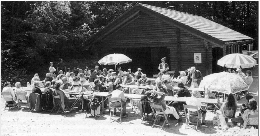
Teilnehmer der Vereinsgründung am Waldhüttentreff in Leutwil